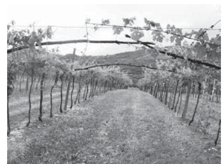
Der Weinberg „Moròpio“ Ende Mai 2011