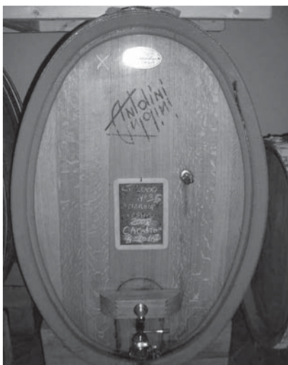
Ein Fass Amarone „Ca' Coato“

Im Herbst 2009 begannen wir die Zusammenarbeit mit den Antolinis, und Sie liebe Kunden haben uns die Weine, insbesondere seinen Ripasso, förmlich aus den Händen gerissen. Schon kurze Zeit nach der ersten Lieferung mussten wir nachbestellen. Zunächst gab es nur einen Amarone von der Kellerei - den Moròpio. Alle Trauben für diesen Amarone stammen aus einem Weinberg oberhalb des Örtchens Marano und ergeben einen feinen, eleganten, dennoch typischen Amarone. Mit dem Jahrgang 2006 brachten die Brüder zusätzlich noch den Ca' Coato, einen Amarone aus einem Weinberg am Ortsrand von Negrar, deutlich tiefer gelegen als Moròpio mit einer völlig anderen Charakteristik. Viel tiefer, dichter, mit mehr Fruchtsüße, sicher ein klassischerer Amarone, der aber bei weitem nicht die Eleganz des Moròpio aufweist. Kurz: die beiden Weine sind so unterschiedlich, dass wir uns sofort entschlossen haben, beide in's Sortiment aufzunehmen.